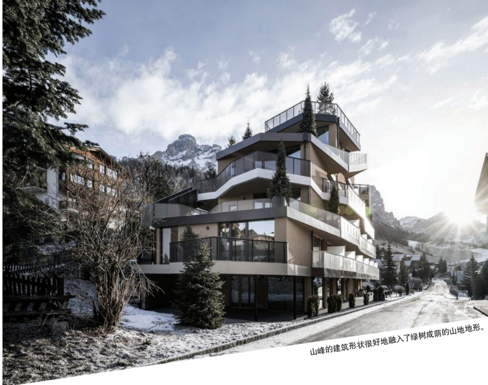
山峰的建筑形状很好地融入了绿树成荫的山地地形。