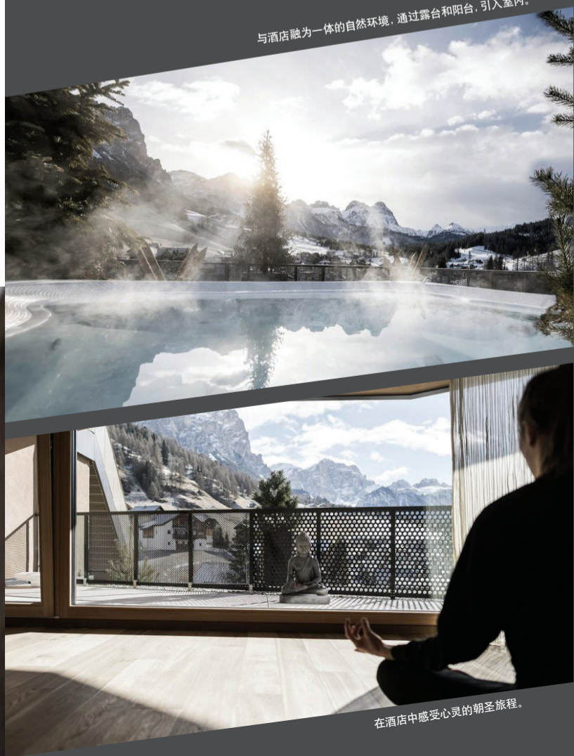
在酒店中感受心灵的朝圣旅程。