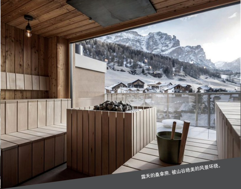
露天的桑拿房,被山谷绝美的风景环绕。