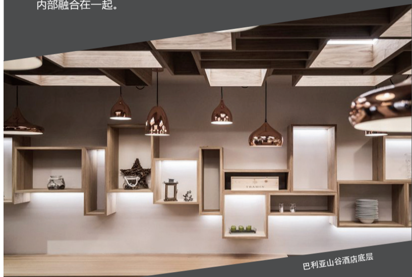
巴利亚山谷酒店底层

酒店种植的针叶树和其他竖线条的植物强调了建筑的外观,使得建筑自然融入周围环境并成为景观的部分。其紧凑的外形具有不规则、不对称的形状,许多边缘像渐变的岩层一样把建筑变成山峰的形态。同时,在阶梯状露台上种植的植物也加强了设计概念,使得外层空间与酒店内部融合在一起。