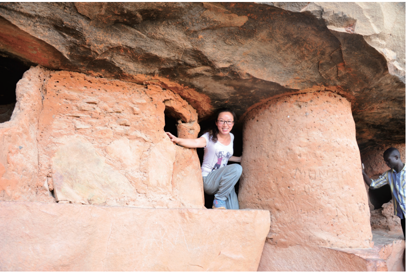
多哥探访悬崖堡垒