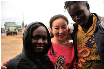
在毛里塔尼亚与鱼粉厂工人一起