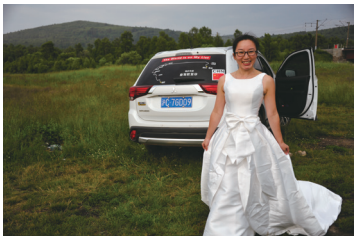
穿着婚纱与座驾留念