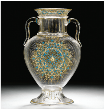
阿拉伯的玻璃制品带有显著的地域特色