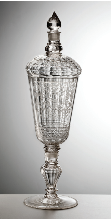
波西米亚玻璃, 以精致繁复的花纹和玻璃切面内反射的虹光著称

传说中的凤凰可以浴火重生, 现实中能浴火重生的, 还有玻璃。玻璃材料来源广泛, 取之不竭, 成型后还可以继续加热再造, 是材料中真正的不死鸟。西方人对玻璃的迷恋就像东方人对瓷器的执着一般, 器型、色泽、光感与使用情景乃至礼仪都包罗万象, 不胜枚举。但是玻璃最与众不同的还是它的透明度和光折射反射后交相辉映, 这可能就是与西方外向型审美产生共鸣的特点吧。