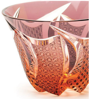
日本的车花玻璃融入本国文化