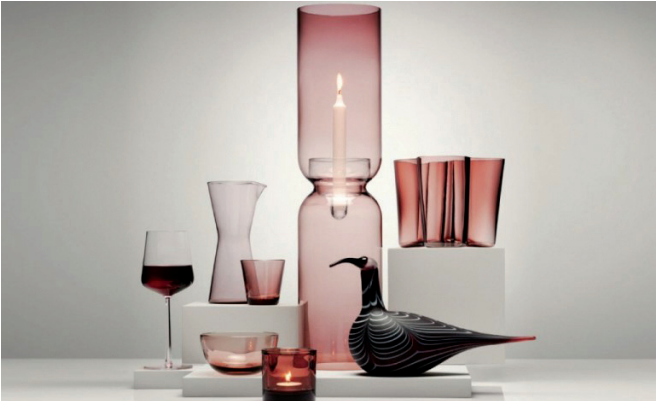
北欧风格更单纯、纯净