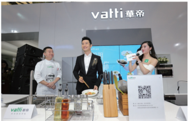
图为华帝品牌代言人黄晓明体验华帝智慧厨房

3月9日，2017年中国家电及消费电子博览会（AWE）正式开展，华帝在本届AWE上举办新品见面会，一举发布智能厨电“魔幻套装”系列新品。与“魔幻套装”同时亮相华帝AWE展馆的，还有华帝后厨房新品“魔净师”全