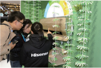
海信男神空调引领“懂湿度”消费新潮

据介绍，海信男神空调系列分别有高颜值、高技术的香槟金、珍珠白的两款挂机（Q5和Q3）和一款柜机（X6），因智能温湿双控能够实现空调对温度、湿度精准控制，填补了国内空调行业这一过去空白地带，让空调在最短的时间达到人体所需的舒适区间，一举攻克解决了传统空调