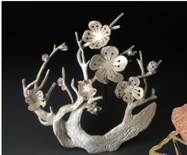
吴二强《风骨·梅》胸针