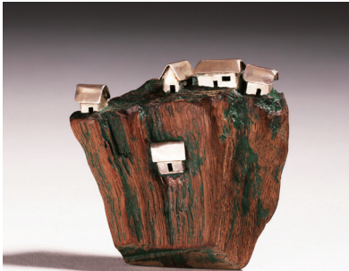
吴二强《乡恋》艺术胸针