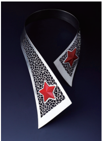
吴二强《红色记忆》项饰