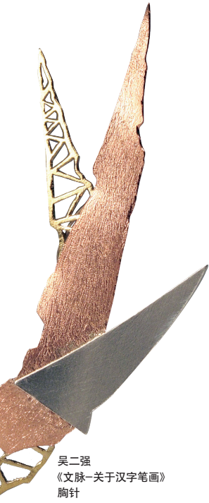
吴二强《文脉-关于汉字笔画》胸针

记得吴冠中先生说过,“风格是人的背影,别人看得到,自己看不到。”先生虽不强调自己的绘画风格,而观者却都认识他的画。中国文人艺匠历来追求一个品质,就是“存傲骨去傲气”,作品要个性鲜明,为人则是谦谦君子。但同时又有一种不自觉叫“文人相轻”,因为观点认知的个性化,会对有些不同观点有“不予苟同”的心态。或许这并非坏事,文化艺术作品个性突出才能打动观众,自然也要允许创作者的个性存在,这就利于作品风格的形成。