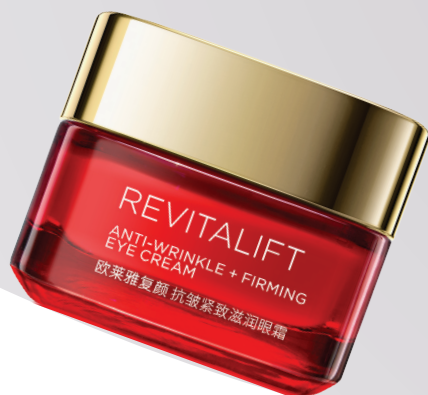
巴黎欧莱雅复颜抗皱紧致滋润眼霜 15ml/RMB220 (新春限量版)