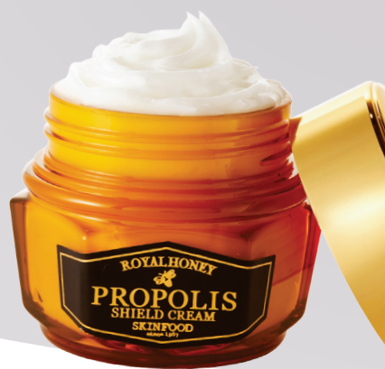
SKINFOOD蜂蜜活颜蜂胶修护霜63ml/RMB295