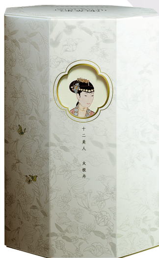
佰草集 太极·吐故纳新·臻致还幼精华——故宫版 350mg49+1.27ml49/RMB780

或许，你边追剧时，可以边用带有按摩头的眼霜做个按摩，眼霜的这个按摩头并非什么“非用不可”的神器，但既然设计出来了，就必然有可取之处。有些眼霜的按摩头取用特殊材质，比如有一种叫“扎马克低温锌合金”的材料，可以让表层肌肤瞬间降温1.5摄氏度。为什么要“降温”呢？因为它能主动构建皮肤低温环境，有助于规律肌肤细胞活动，正负金属因子，令处于负酸性状态的肌肤呈平衡稳定状态，零价态的人体皮肤内部环境，可减少自由基生成。