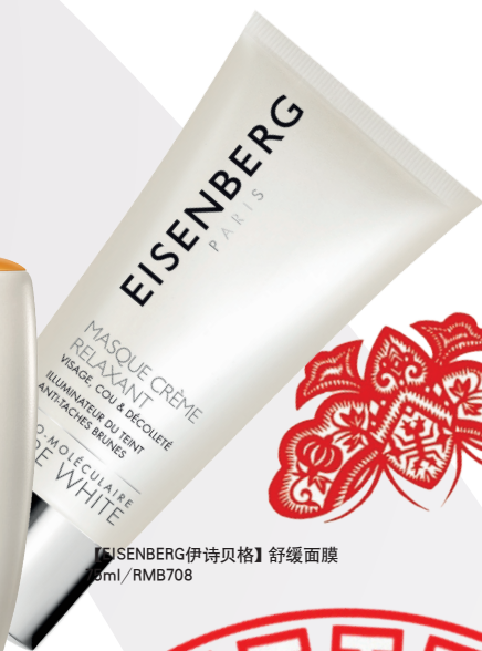
【EISENBERG伊诗贝格】舒缓面膜 60ml/RMB708