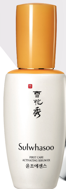
雪花秀润致焕活肌底精华露 60ml/RMB600