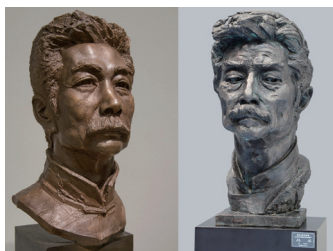
其他艺术家泥塑翻制鲁迅