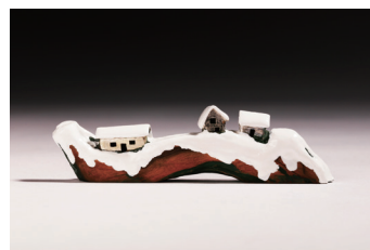
吴二强《故乡·雪》艺术胸针