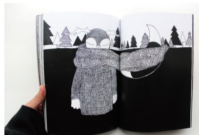
《我想做个好孩子》绘本部分页面