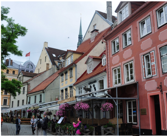
老城广场上的游客