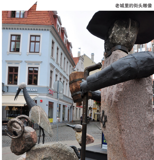
老城里的街头雕像