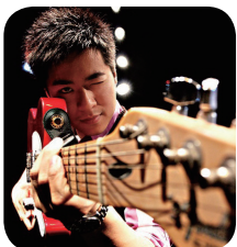
丁丁 动感101知名主持人