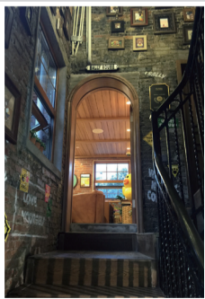
复古地砖与红色砖墙相映成趣