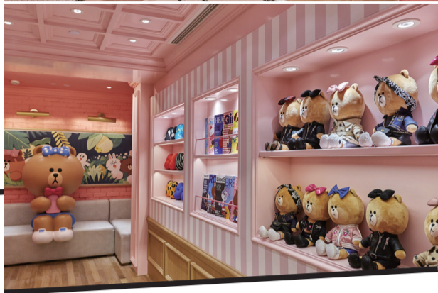
蓝全粉色容易过腻，粉色条纹设计，让人觉得温馨不发腻