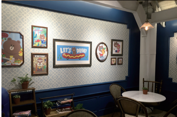
颇有英伦复古范的装饰，很适合享用一顿纯正的下午茶