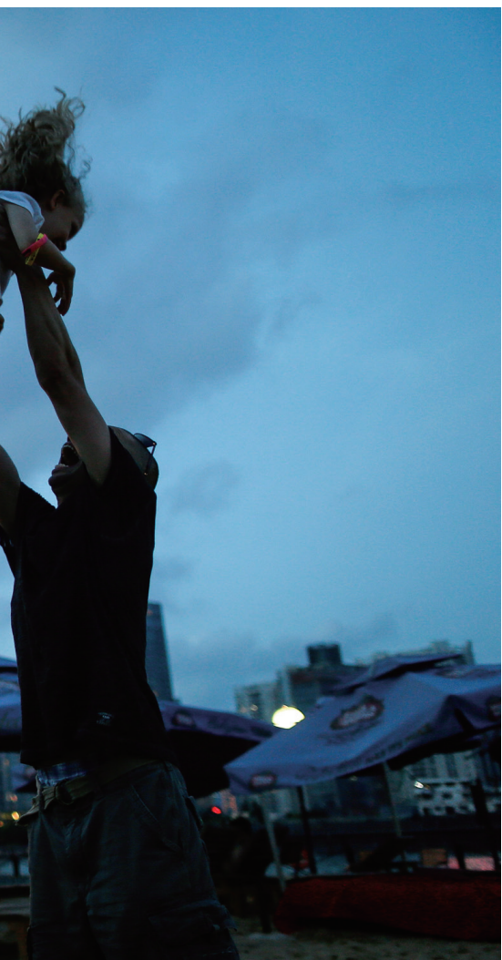
2014年8月30日，上海，夜色降临，华灯初上，一名男子带着女儿在江边嬉戏。

我更加珍惜每一次拿起相机，按下快门的机会，希望每一张照片都是独一无二的，希望照片背后的故事也是质朴真诚的。