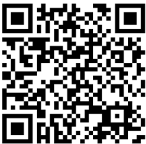
扫二维码进青意社微店