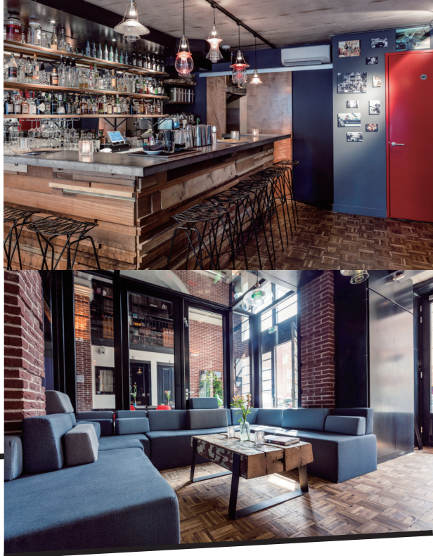
蓝色低调的沙发随意摆放在酒吧门口，让路过的人可以休憩。