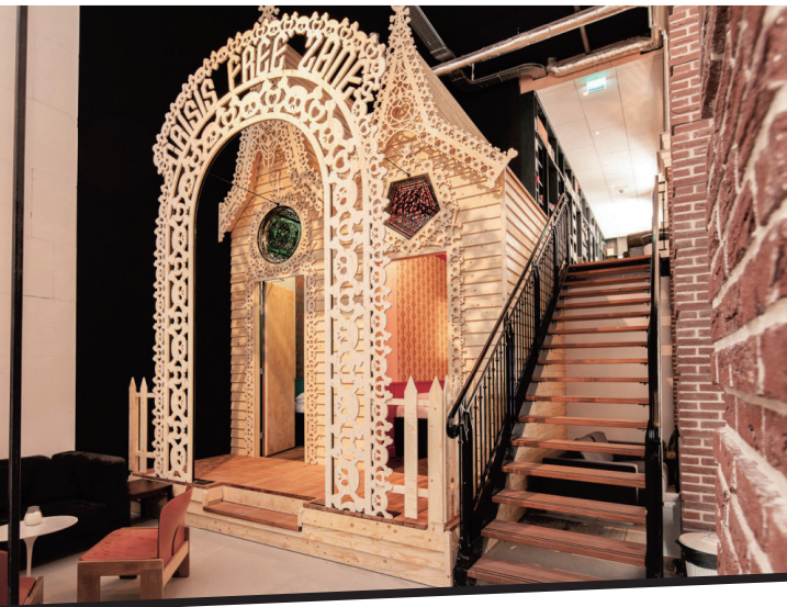
周身繁复雕花显得富丽堂皇，甚至连床边的脚踏也被雕花装饰铺满，这仅仅是一间像皇宫的客房。