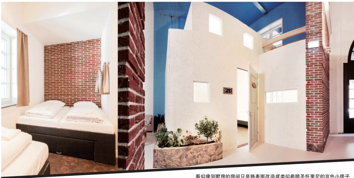
看似别墅房的房间只是将表面改造成类似希腊圣托里尼的蓝色小房子，同样能享受到阳光带来的温暖，微风拂来的舒适。