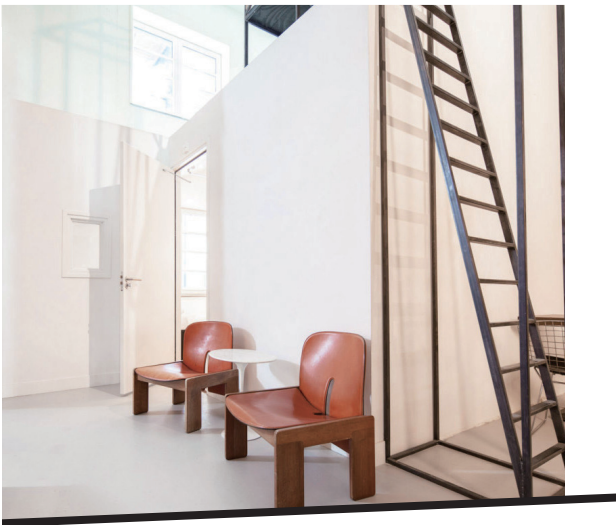
“乌鸦的鸟巢”，找不到房门，需要踏上楼梯才能恍然大悟。