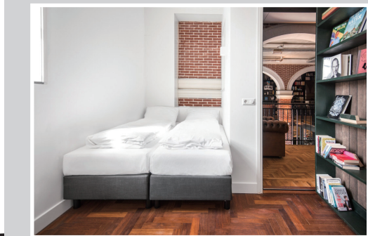
如果服务员带你走到一整个古色古香的书架之后，千万不要觉得惊讶，你的房间就在我推开书架的咫尺之间。