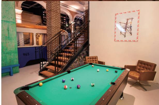
古老的电车装饰，以及在电车上的各种娱乐设施都配套在这间房间中。