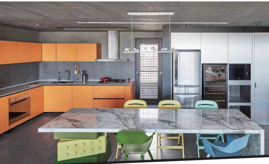
餐厅中清新自然的乐高积木是点缀，和橙色橱柜形成对比。