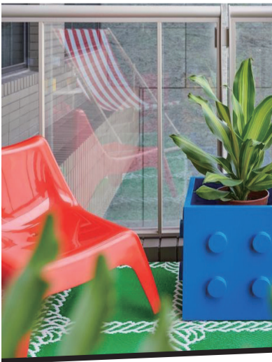
阳台的绿色的方格地毯，红色的塑料椅和乐高积木形状的花盆托，处处透着童真和惬意。