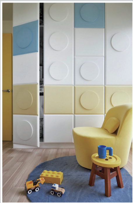
卧室色彩明快，黄绿白蓝的乐高元素，充满童趣。