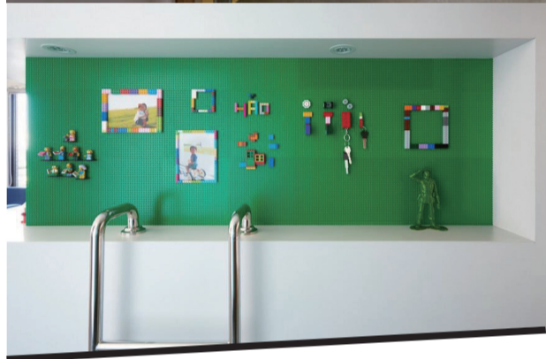
玄关的墙面上可以放置主人自己收藏的乐高玩具或者创意布置属于你自己的乐高墙。