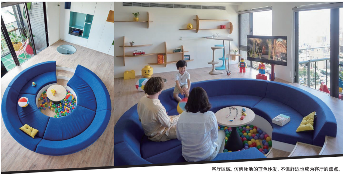
客厅区域，仿佛泳池的蓝色沙发，不但舒适也成为客厅的焦点。