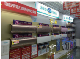
海信空调第三届制热节28日正式启动

近日，一场海信专属的空调业制热节快速抓住市场的眼球，节能惠民补贴、新品炫彩空调等吊足消费者胃口。对此，业内人士指出，随着2017新冷年竞争全面开启，一轮回归产品品质和用户需求本位的竞争开始主导整个空调产业发展新风口、新趋势。背后企业，基于变频技术创新和用户需求升来之际打响一轮以新一代变频空调为