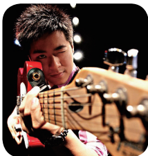
丁丁 动感101知名主持人