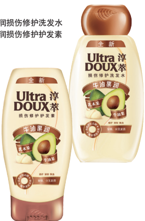
淳萃 牛油果润损伤修护洗发水 淳萃 牛油果润损伤修护护发素

最近这个新的洗护发品牌很火，找了个“小鲜肉”来做代言。这款牛油果润损伤修护系列，洗发水的泡沫丰富、绵密，洗完后头发蓬松、香味轻甜宜人。牛油果成分富含维他命E修护受损秀发；乳木果则富含天然营养脂，能带给秀发健康生机。