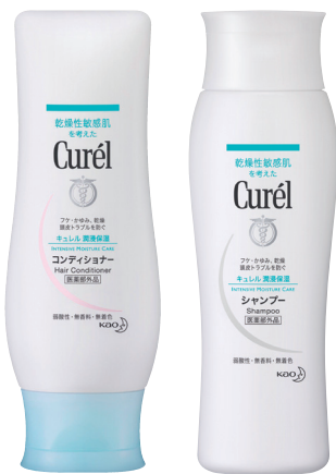
珂润润浸保湿洗发水 RMB48/200ml 珂润润浸保湿护发素 RMB48/200ml

针对干燥、敏感肌肤的珂润，其洗护发产品在业界也非常有名。承诺弱酸性、无香料、无色素的配方，就连婴儿也可以使用。洗完后，头发非常蓬松。但这种蓬松与特地添加顺滑成分的“滑”有所不同，它的配方是有助于防止头发毛糙发硬，从而使头发变得柔软、顺滑。所以，特别适合敏感头皮用，尤其是那些一到秋天、冬天头皮就干到发痒、落屑者，使用特别有效。