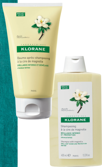
康如亮泽水润洗发露 人民币168/400ml 康如亮泽水润护发素 RMB128/150ml

康如的洗发产品主打植物、安全概念，并且提倡使用植物萃取成分让头发变得顺滑。比如这套洗护产品中，是从法国的荷花玉兰叶中萃取得到的优质玉兰叶蜡，来作为填补毛鳞片空隙、抚平角质层之用。使用后，发丝表面立即恢复平滑，其天然保护膜将获得重组修复，水分被锁住，秀发愈加水润柔韧。