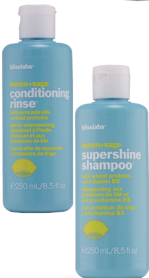
芭丽丝柠檬鼠尾草亮泽洗发露 RMB150/250ml 芭丽丝柠檬鼠尾草护发素 RMB150/250ml

清新柠檬香味的洗发露和护发素，使用后心情也会变得愉悦起来。其中富含小麦蛋白，清洁秀发的同时修复干枯受损秀发，抗静电。为秀发造型增加“抛光”程序，亮泽柔顺，耀眼迷人。