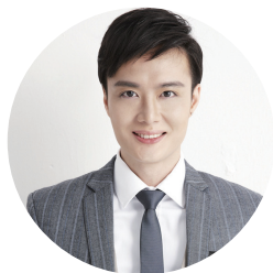
健兴 benneth 魅力造型专家

这套旅行装非常适合短期出差、旅游随身携带使用。它针对染烫损伤发质，修护染烫损伤，给秀发补充充足滋养及弹力，抚平毛躁并牢牢锁住着色，减少分叉。研究发现生活用水中的钙离子会积聚在头发内外，导致头发变得脆硬干枯，而这款洗护产品中的水源净活成分可以在洗发时有效去除积聚在头发上的钙离子，令后续护发成分充分渗透。