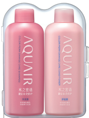
水之密语 染发修护系列迷你装 50ml*2