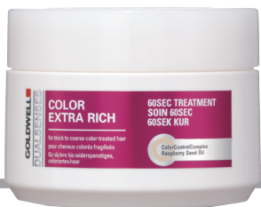
GOLDWELL歌薇柔彩修护发膜 ROM198/200ml

刚刚染完后的头发，色彩炫目耀眼，酷得不得了！但一旦用洗发水洗完之后，肯定会褪色。越是鲜、亮、好看的颜色，掉得越快！而使用固色的发膜，则能稍稍延缓掉色时间，并且对染后的头发进行一定修复，不至于掉色后变得枯黄。这款发膜里，有个凝胶科技配方Fade Stop Formula，能够对头发上的颜色分子“加固”，还具有提升染后发色光泽度的效果。