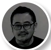
腓力圃·叶 PYD设计机构