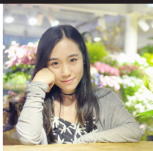
树一 Shu yi 独立摄影师

A: 伊瓜苏大瀑布。壮观二字可能都难以完全形容它的形态。阳光被瀑布激起的水雾分解成无数道彩虹。没有什么比站在伊瓜苏大瀑布前淋一场雨来得更痛快。当我乘着船，船员带着我们冲入大瀑布的水幕之中，这一刻能深切感受到大瀑布的“洪荒之力”。到了傍晚时分，瀑布旁升起一层浓重的水雾，遮住了炙热的晚霞，整个天空都被粉色的云霞笼罩着，太阳一点点沉下去，湛蓝的夜幕渐渐拢上来，一条清晰无比的银河在眼前倏然铺展开。这是我第一次这么明显地感受到昼夜的交替，那一刻内心是平静愉悦的，因为你知道混沌的那头永远有光。