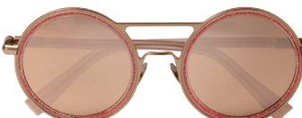
CUTLER AND GROSS