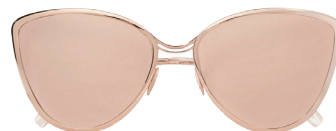
CUTLER AND GROSS

首先,颧骨宽是很多亚洲女生都会面临的烦恼,颧骨宽很容易显得下巴和额头窄,所以较为宽大的椭圆形墨镜会很适合她们,很好地柔化了颧骨的线条。其次,那些相对脸方的女孩们就适合带那些正圆形的墨镜,乍看之下会看起来有些卡通,但是却很好地让你的脸不会“那么方”,切记请勿选择有棱角的墨镜,那样会把你的脸变成一个多边形。再来,额头较宽下巴较尖的三角脸,这样的女孩们非常适合那些经典的“蛤蟆镜”,可以让你的脸变得立体些许,也把视线集中到颧骨处,减少视觉上额头的宽度。最后,就是圆形脸了,肉嘟嘟的脸适合用猫眼形状的墨镜来增添一些棱角,让你原本肉肉的可爱脸庞多了几分气场。