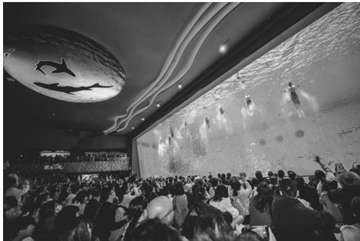
假期,上海海昌海洋公园吸引大量游客到访。