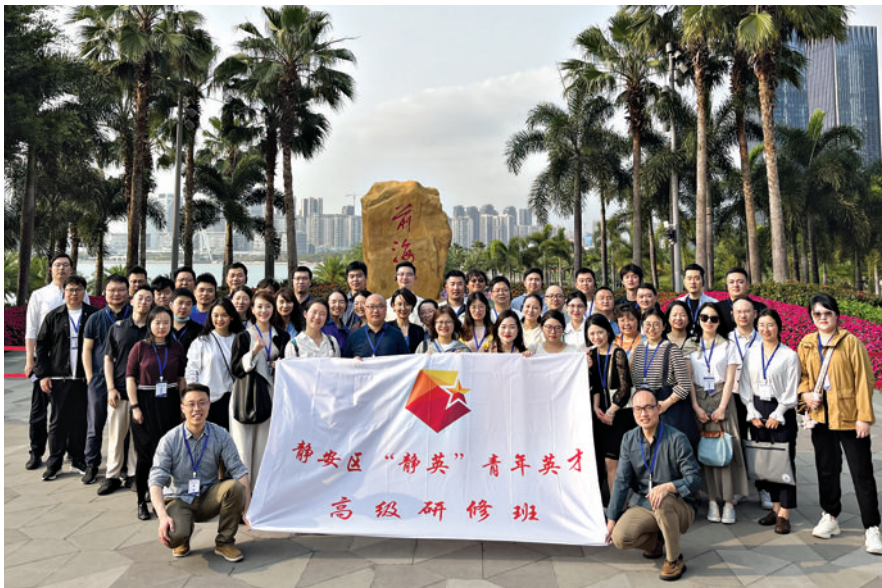
静安区“静英”青年英才高级研修班。

“阿婆,这是改建后的增量面积,房型是朝南的,阳光很足的。”在静安区天目西路街道蕃瓜弄小区,“添睦心”青年突击队战旗正飘扬在改造、旧住房拆除重建一线。在“青年发展型城区”建设试点的持续探索中,14个街镇的青年们积极在岗位建功,升级了青春“战斗力”。