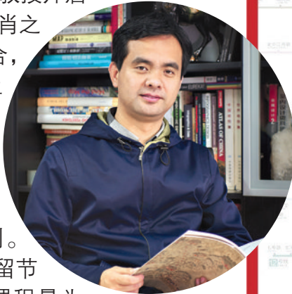
青年报记者 刘昕璐

这是唐曦从2018年依据地铁路网图绘出中华田园犬开始的一场“较真”,之后的每个生肖,他都成功从中找到。小小创意,既是这7年来“贺新春”的保留节目,也成为了每年春季学期《地图学》课程最为特别的打开方式。