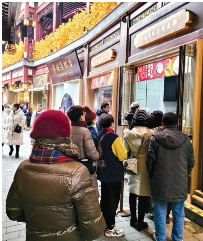
宁波汤团店外排起长队。

阴雨天气，请大家出行注意交通安全。同时，受寒潮影响，气温低迷，市民朋友们也需注意添衣保暖。