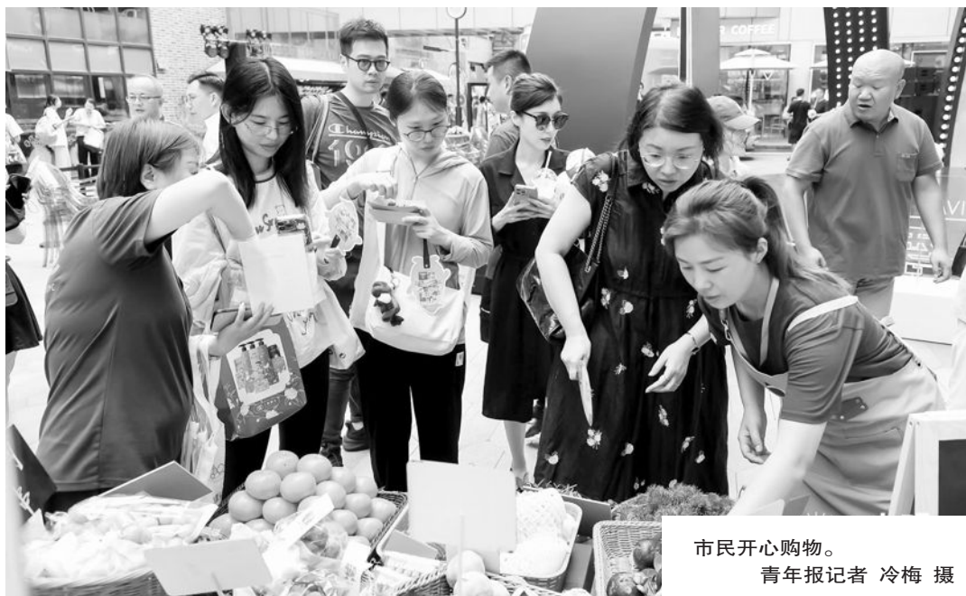
市民开心购物。

时尚产品与日用商品荟集，打造多彩消费盛宴。光明食品集团聚焦消费需求，推出老字号跨界、大白兔新品主题快闪活动。华谊集团牵头组织下属主要消费品企业回力、制皂、双钱公司参与促消费行动，通过线上线下促销活动为消费者让利。东方国际承办2024春夏上海时装周，携手抖音平台深度融合直播新经济，塑造上海消费季城市氛围，促进市场活力。绿地集团