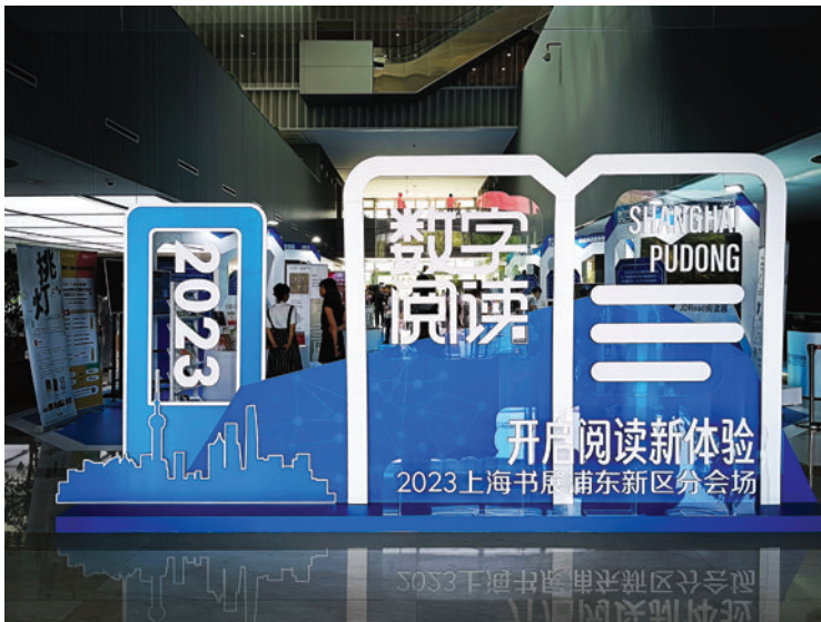
主打“数字阅读”的浦东分会场活动昨起举办。