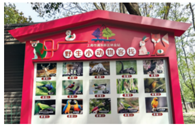
野生动物收容站。