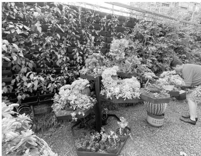
“三不管”地带变身美丽花园。

区林长办、区绿委办积极培育扶持各街道居民区的自治组织,深入对接街道林长办、街道绿委办,第一时间挖掘到该居民自治点,实地走访了解建设情况,通过加大宣传、落实扶持措施,进一步提升居民自治组织工作服务水平。