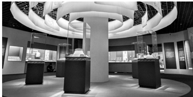
实证中国:崧泽·良渚文明考古特展。

为更好地将观众带入这次中华文明探源之旅,上海博物馆将针对不同年龄、身份的观众,开展一系列线上线下形式多样、展厅内外种类丰富的公众教育活动。微信导览、智慧导览等多种导览方式,以及成人和儿童两版折页,将为观众提供多种学习资源,助力观众读懂文物、看懂展览;学术讲座将邀请相关领域的十多位专家学者,带来高质量、高水平的知识分享;工作坊将采用亲子阅读、展厅探索、遗址考访、科学实验、教师研习等多种形式,突破展厅限制,给观众带来更多深入体验。