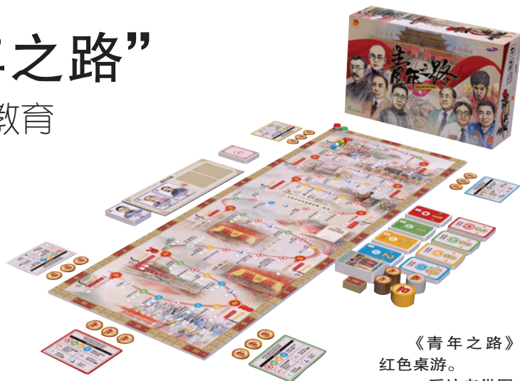
《青年之路》红色桌游。

不忘来时路，方知向何行。集教育性和趣味性为一体的《青年之路》规则简单易懂，参与者依托党史知识积累、游戏策略熟识，能够沉浸式感受到中国共产党百年历史的艰辛与荣耀，在参与者将每一个事件支流汇入到党史长河的过程中时，无人不从内心燃起对于国家的认同感。“通过桌游可以沉浸式地感受到中国共产党百年历史的艰辛与荣耀，加深对党的理想信念的认同感，以青春致敬党的百年奋斗