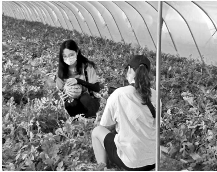
农业合作社来了大学生。

“组织乡村休闲游的活动过程，是在向真实且复杂的工作环境靠近，是逼自己去尝试带队，去串线整个活动的难得机会，而不是按部就班地让干什么就干