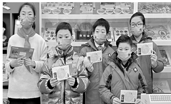
“红色印记”青少年交流交往系列活动。

本次活动由上海第九批援藏干部联络组、上海市第四批援青干部联络组、共青团上海市委合作交流部、中国文化信息协会红色收藏专委会、上海新四军“沙家浜”部队历史研究会、上海市互联网新闻研究中心、中国邮政集团有限公司徐汇区分公司等单位共同主办。