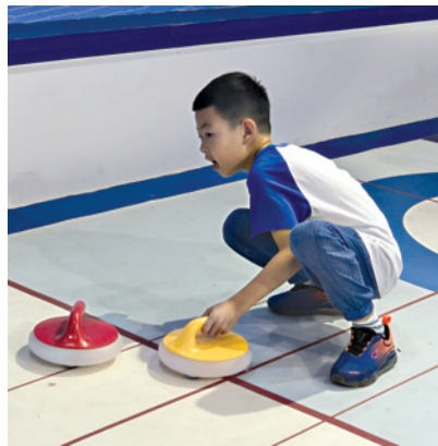
小朋友现场体验冬奥会比赛项目冰壶。

走进体育服务专区,处处呈现冬奥会的氛围,特别是北京2022年冬奥会和残奥会组织委员会的展区,通过数字科技等形式展示了多项冬奥会比赛项目,墙上还张贴了体育项目介绍,速度滑冰、短道速滑、冰球、单板滑雪……不少带着孩子来参观的家长指着图文为孩子讲解。