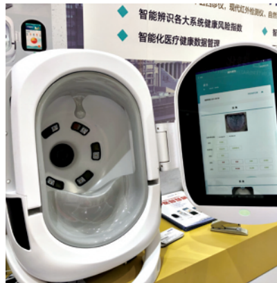
中医四诊仪可实现快速体检。

作为服贸会的热门看点,位于健康卫生服务展示区的中医药主题活动设置了近1000平方米的展区,来自不同地区的50余家机构参展。在上海中医药国际服务贸易平台展区,雷允上、上海神象等百年老字号与海上中医、上海国医馆新品牌相辉映。