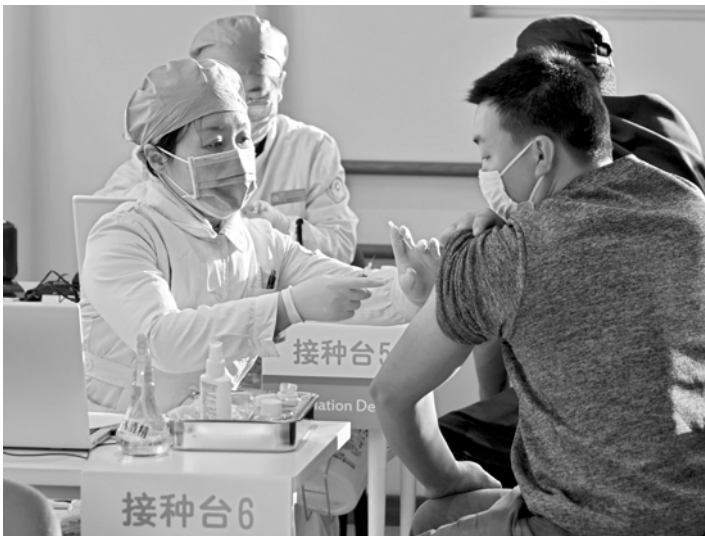
医护人员为接种人员注射疫苗。

其他禁忌症还包括：严重的肝肾疾病、药物不可控制的高血压、糖尿病并发症、恶性肿瘤；各种急性疾病或慢性疾病的急性发作期；严重呼吸系统疾病、严重心血管疾病等。