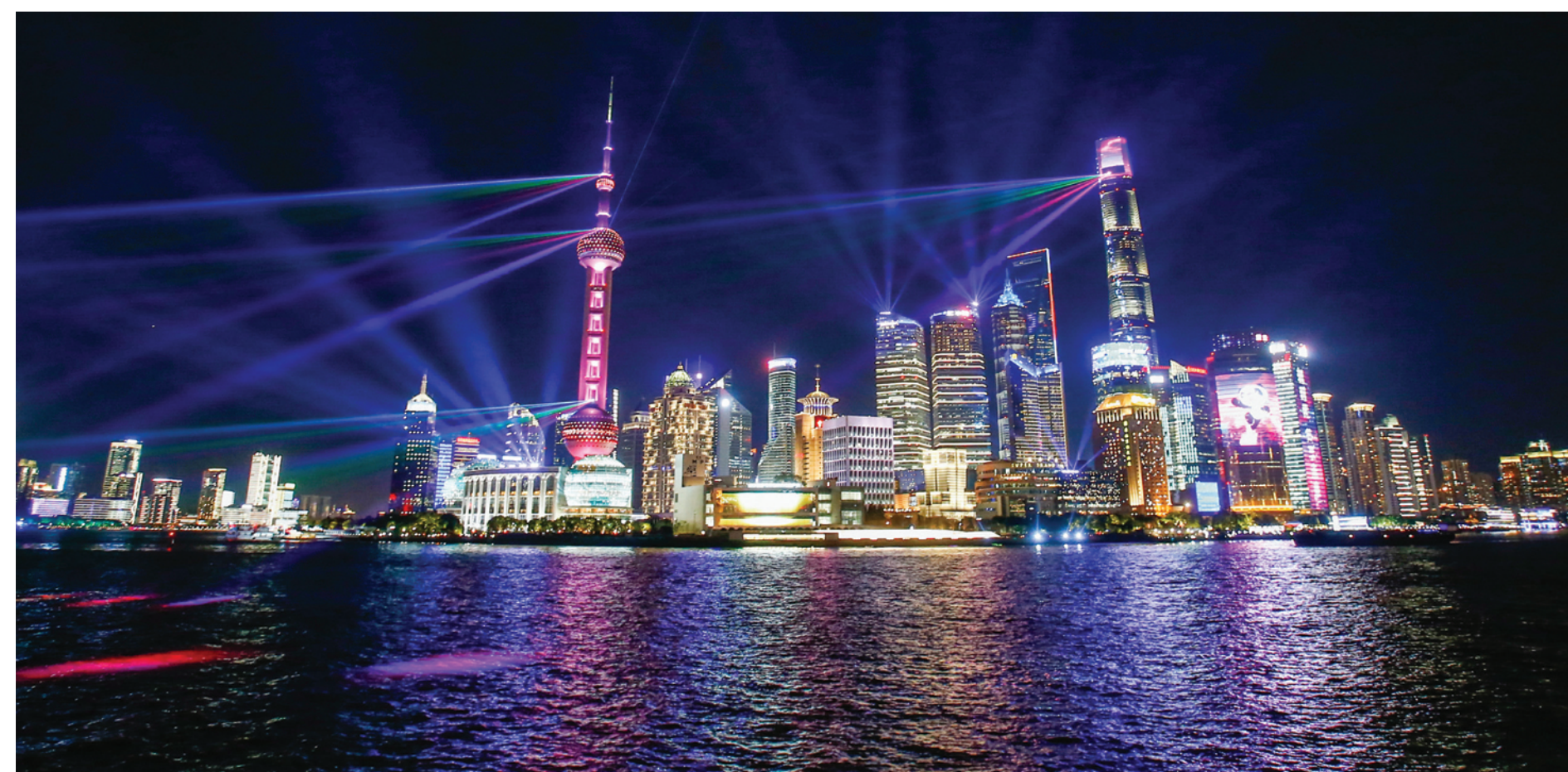
进博主题光影秀昨起在黄浦江畔上演。