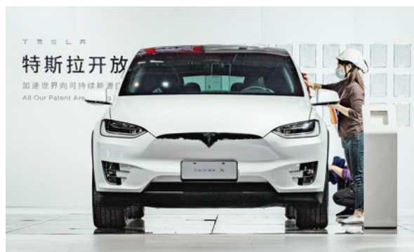
特斯拉开放 加速世界向可持续能源 All Our Patent Are