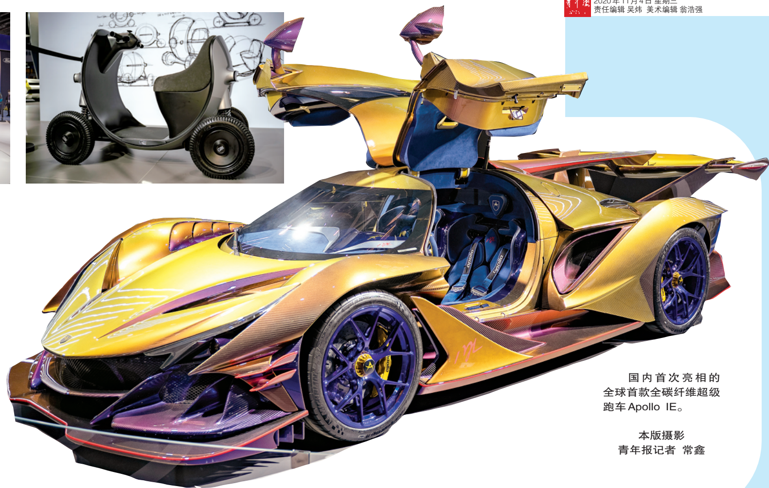
国内首次亮相的 全球首款全碳纤维超级 跑车 Apollo IE。