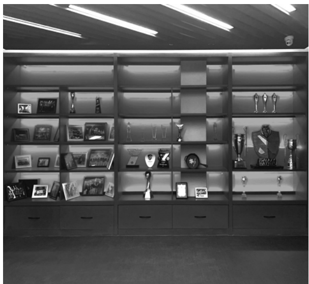
位于闵行梅陇的“游悉谷·电竞文体产业园”去年开园。