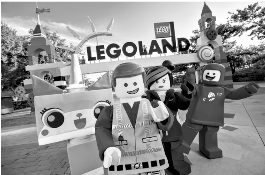
乐高乐园将为上海市民呈现深受全世界儿童和家庭喜爱的品牌乐园。