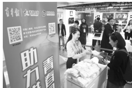
青春上海互动体验馆。

据介绍,东浩兰生国贸集团新零售平台“多鲤购”作为进博会上海交易团认证的“6+365”交易服务平台,将入驻青春上海Act+活动福利平台,今后双方还将为全上海的团员青年提供更多“进博会好产品”线上服务,通过各方合作升级共青团服务青年的能力,以提升青年报·青春上海与东浩兰生在青年中的品牌形象。