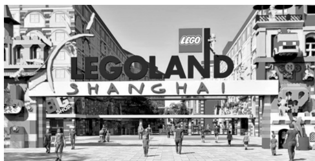
上海乐高乐园概念图。

丹麦乐高品牌集团执行主席袁威也表示,将乐高乐园带到上海金山,将为中国家庭提供更多乐高玩乐体验的机会,“在过去的五年中,乐高品牌在中国获得了积极的反馈,成年人重视通过玩乐获得学习和发展的益处,而儿童则享受奇妙的玩乐体验。我们期待着继续进行投资,为上海和长三角地区的家庭带来更加激动人心的体验。”