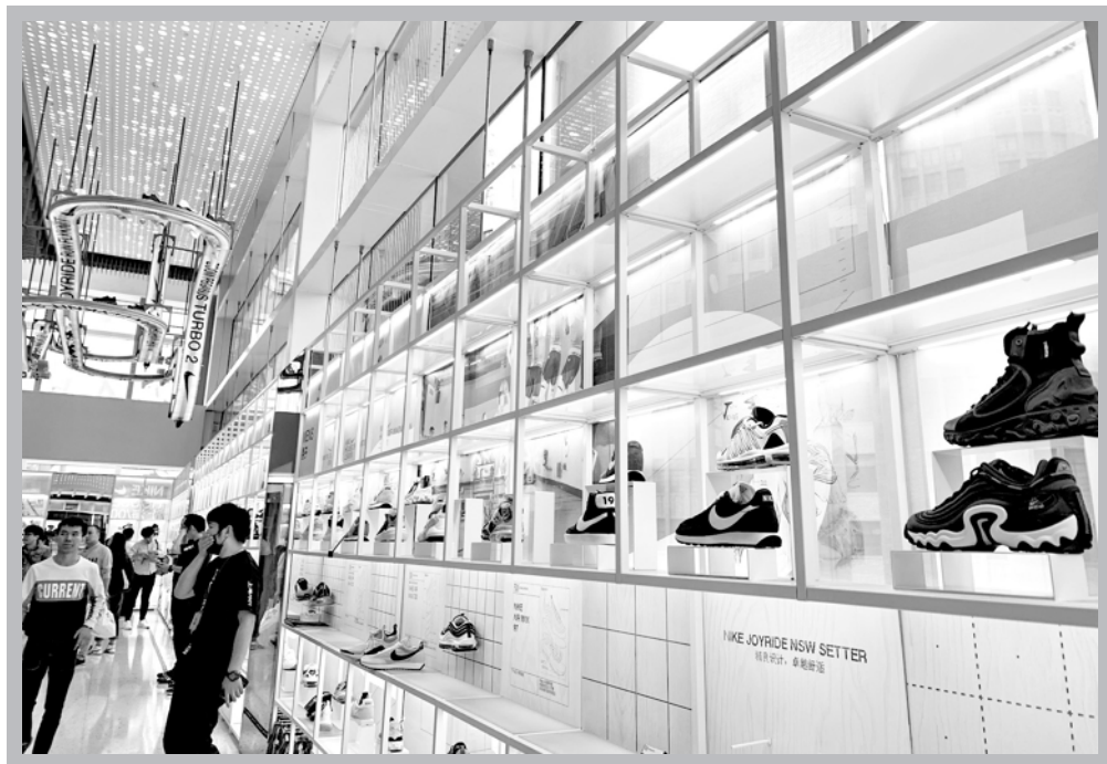
“炒鞋”兴起后，鞋价直线上升。

事，尤其是在鞋价飞涨之后，许多球鞋的价格更加遥不可及。网上曝出的所谓“鞋王”，多半家底殷实，很多篮球运动员也因为收藏了大量超限量款球鞋受到鞋友们的追捧，但不能忽视的是他们大多年薪千万。对于普通的球鞋爱好者而言，借着“炒鞋”的东风，用“以鞋养鞋”的方式继续自己的爱好，也成为了无奈之举。