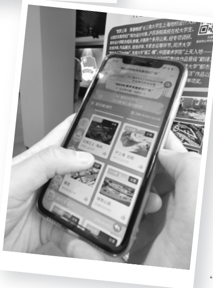
▲ 市民通过新媒体平台参与网络作品展示投票。