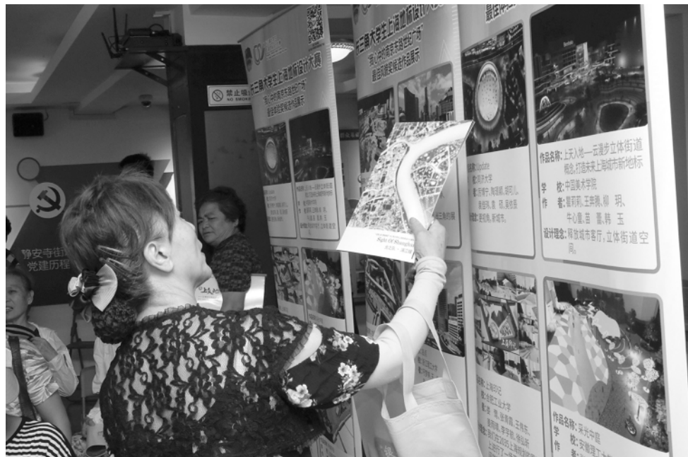
团队成员第一次走进社区与居民面对面。