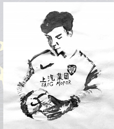
李锦辰为公益T恤绘制的颜骏凌肖像。

上港集团足球俱乐部与《青春上港》这次共同推出这款由自闭症儿童创作的颜骏凌肖像公益T恤，也是为了让更多的人感受到这些星星的魅力，感受到他们对足球的热爱，对这座城市、这里的球星的热爱。相信社会会用关爱回报他们的热爱，用公益的温暖让他们觉得永不孤独。