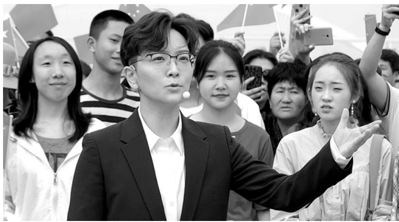
上海京剧院国家一级演员王珮瑜的念白，给现场观众带来惊喜。