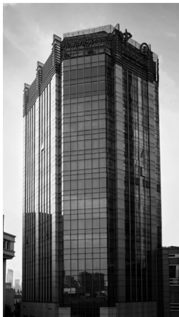
上海嘉豪淮海国际豪生酒店外景。

不仅如此,屡获殊荣、具有40年海派本帮菜经验的大厨倾情为贵宾打造以传统的本帮菜系为主,结合海派、川、粤菜系等的菜品,既能让贵宾品尝地道上海菜,也能体验不同菜系的独特风味。现代的装潢和设计理念将传统本帮和独特地方菜诠释得相得益彰。给客人私人宴请、商务聚会都带来不同凡响的感受。