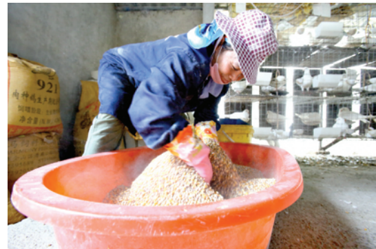
调配饲料,提高鸽子的产蛋量。