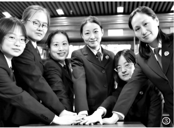
① 上海市人社局就业促进中心职介团队。

针对辖区内利用未成年女性进行违法犯罪活动类的案件高发的态势,他们办案团队还积极参与社会综合治理,分别联动公安机关、司法行政部门、新区妇联、12355青少年保护平台以及外省驻上海办事处等五个单位或组织开展了一系列综合治理工作,形成“五角星工作法”,对此类案件重拳出击、消除治安隐患。