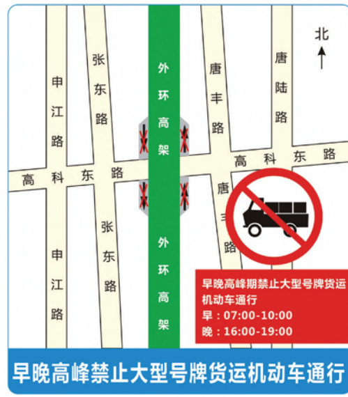
早晚高峰禁止大型号牌货运机动车通行