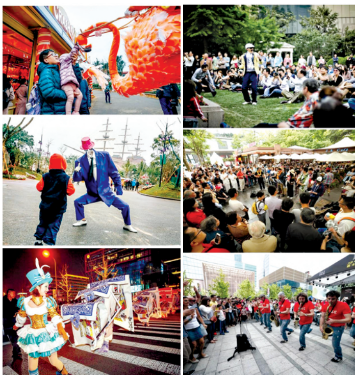
从小而美、小而精起步，不拥有传统意义上“大型文化地标”的静安，也能打造属于自己的大型文化品牌。