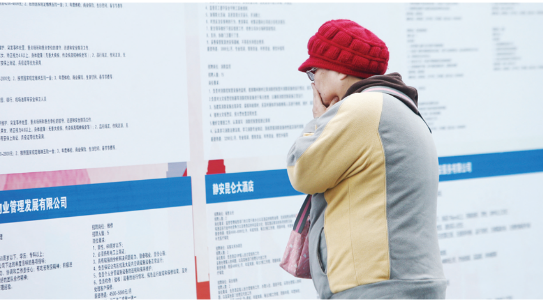
“春风行动”系列就业活动在上海各个区陆续开展。