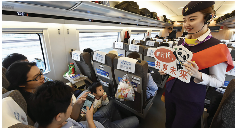
“进口博览会主题宣传列车”首发。