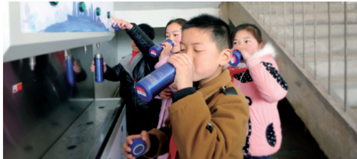
2018年3月22日,安徽宿州马场小学的孩子们体验由“绿动未来”环保公益平台捐赠的爱心净水设备。