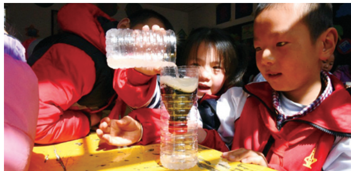
2017年3月20日,甘肃环县当地的小朋友在“绿动未来”志愿者的带领下学习净水原理。

或是多了爱水护水的小愿望、或是做宣传画和大家一起节水、或是终于喝到干净水的满足……在这场名为“一杯水的约定”主题征文比赛中,安徽宿州顺河乡几所小学的孩子通过作文的形式,表达了“一杯水的约定”为他们带来的一些切身改变。