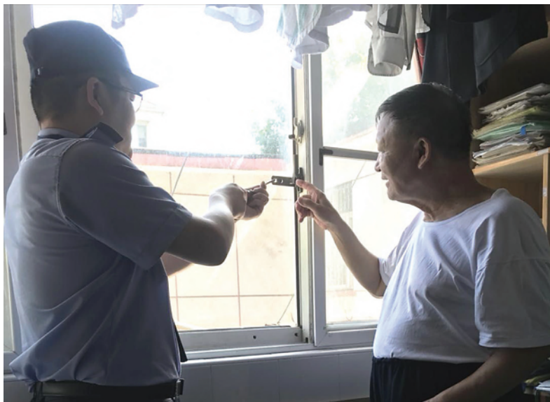
杨浦公安为市民安装防盗限位器。

2017年年底大调研工作开展后,杨浦公安分局治安支队通过对地区警情和治安状况的综合分析与调研,与相关设计公司一起研发了一款多用途防盗窗锁限位器。与传统的